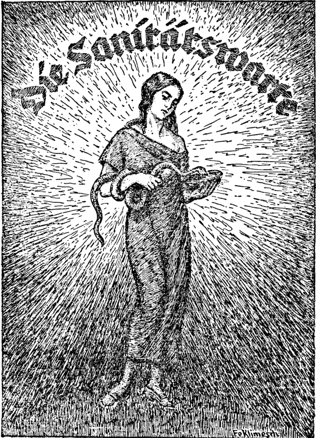
4. Reichs-Konferenz Sektion Gesundheitswesen

er ung ab: ten ung ir. lege ung rt. 915 halb- ten? -M. en ten weiter 2 nd ter, ter- r 24 S bis Marf - arf lab- Der alle, ber iefed ten 12